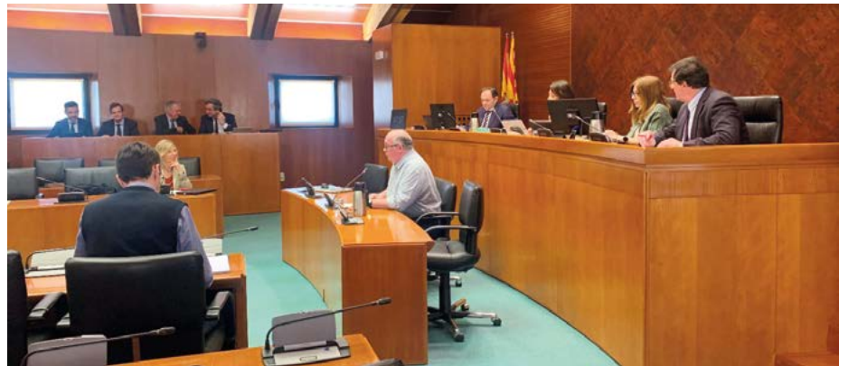
Comparecencia del Decano del Colegio Oficial de Ingenieros de Montes en Aragón en las Cortes regionales

La comparecencia tuvo lugar el 8 de abril siguiente, y en ella el Decano expuso el parecer favorable del Colegio a los impuestos que con un carácter extrafiscal traten de corregir los impactos medioambientales de los parques eólicos y fotovoltaicos, y (si no pueden ser totalmente corregidos) traten al menos de compensarlos. No obstante, insistió en que es imprescindible que haya una real afectación finalista de lo recaudado a la mejora del medio natural, que es el bien jurídico protegido principalmente afectado: “Señorías, desde hace 19 años la ley aragonesa afirma que la recaudación de los impuestos medioambientales se destinará íntegramente a la financiación de medidas restauradoras del medio ambiente. Pues bien, puedo asegurarles que el medio natural, y el sector forestal en especial, no ha notado nada de estos ingresos”. Propuso en concreto reservar un mínimo de un