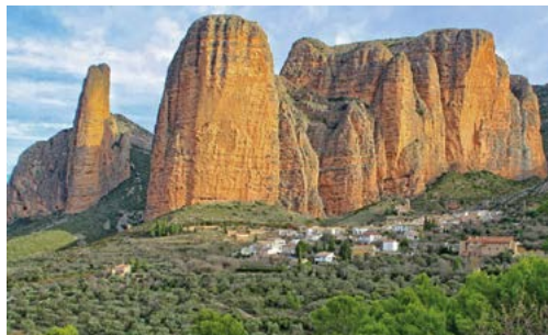
Vista de los Mallos de Riglos (Huesca), con el pueblo de ese nombre a sus pies.

competencias estatales al regular o prohibir el uso de drones. A este respecto, el Colegio señaló que ya había advertido de esta circunstancia en las alegaciones que presentó en abril de 2021 ante