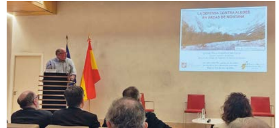
Un momento de la ponencia sobre aludes del Decano del Colegio Oficial de Ingenieros de Montes en Aragón

Hubo otros dos Ingenieros de Montes ponentes en la Jornada, lo que muestra la