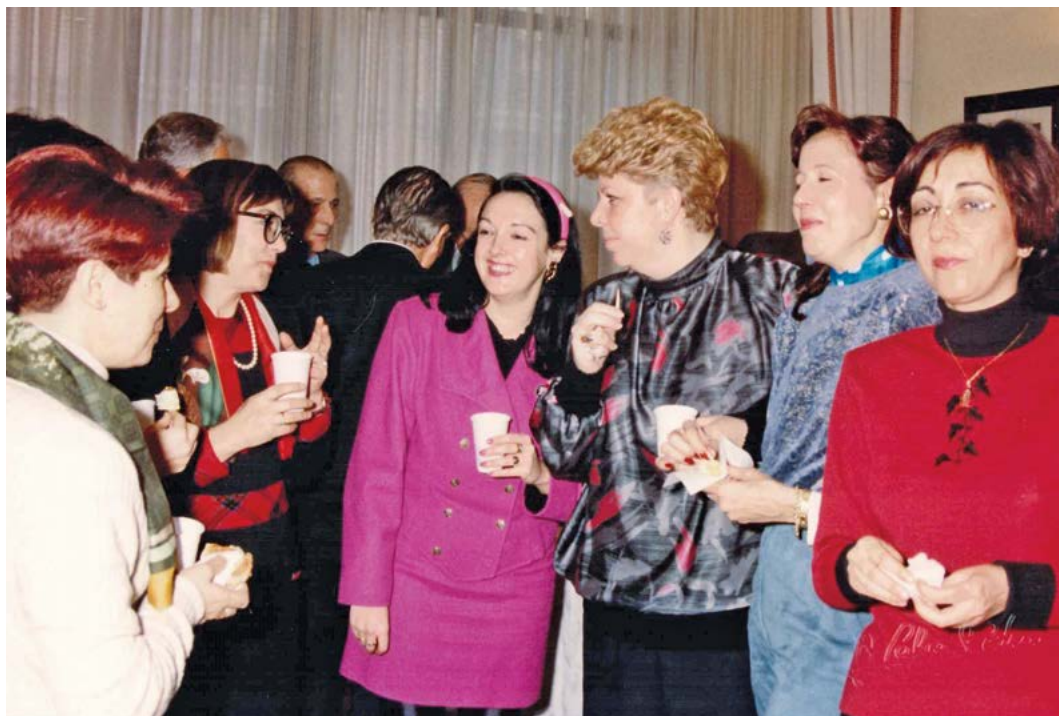
Mujeres abogadas en 1992.