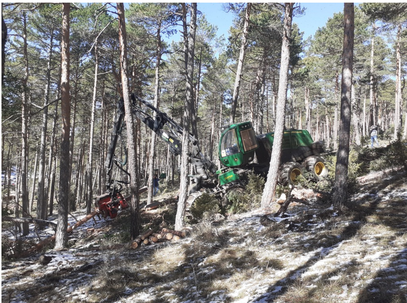
Visita de campo al aprovechamiento de madera hecho con procesadora forestal en el monte "El Saladar" (Monteagudo del Castillo).

de la importancia del aprovechamiento de la madera para el futuro de los pueblos. Pronunció la expresiva frase "el pueblo que no huele a madera, acabará oliendo a humo", que alude a que el aprovechamiento sostenible de la madera es una eficaz manera de prevenir los incendios forestales, al vincular a la población con la gestión del monte y evitar la acumulación de combustible.