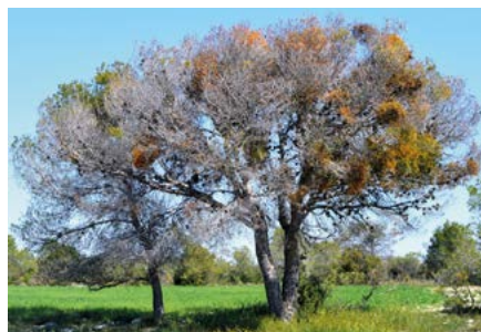
Pino carrasco en Caspe (Zaragoza), muerto a causa de la conjunción de la sequía y de los ataques de muérdago y escolítidos.

Así, se señalaba que en Aragón el muérdago no sólo no está protegido, sino que, por ser una planta hemiparásita, constituye una verdadera plaga en muchas masas espontáneas de pino carrasco de la Depresión del Ebro, en las que el muérdago, en el actual contexto de sequías muy marcadas, causa la muerte de miles de árboles. Se aclaraba por eso que la extracción del muérdago de nuestros montes resulta muy conveniente para el mantenimiento